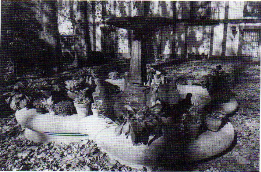
Fig. 3. Fuente neogipcia frente a la Casa Vieja de Mata-Begid.

De todas ellas, la más antigua que se conserva es la llamada Casa Vieja , típica construcción decimonónica caracterizada por la regularidad de sus vanos, cinco por cada una de sus tres plantas, por su realización en mampostería enfoscada