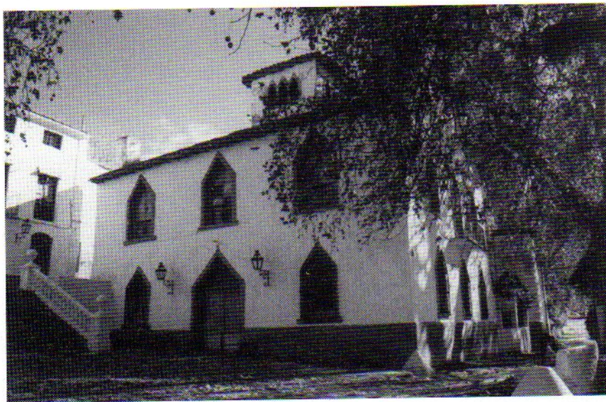
Fig. 4. Casa Nueva de Mata-Begid.

en la fachada lateral, entre dos salientes estructuras de obra, y un patio-jardín trasero con fuente romántica central por el cual se accede a una nueva construcción. La denominada Casa Nueva posee dos plantas y tres series de vanos en cada