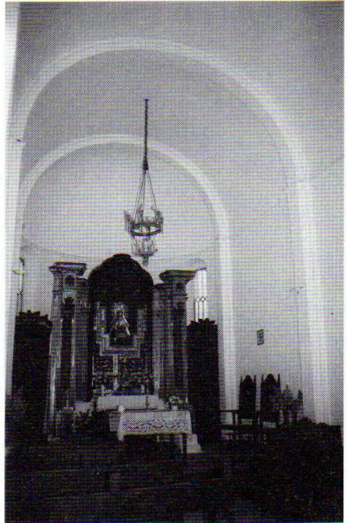
Fig. 2. Ermita de Mata-Begid. Interior.

El edificio se eleva sobre una escalinata frontal para salvar la inclinación del terreno. Su fachada consta de una puerta con arquivoltas en forma de medio punto y una ventana alta geminada; una saliente cornisa subraya la estructura a dos aguas de la cubierta y se corona con una espadaña (fig. 1). El resto del exterior es muy sencillo, con la presencia de contrafuertes alrededor de una estructura que tiene forma absidal; es precisamente en la cabecera donde se abren las únicas ventanas del conjunto, también arquivoltadas y de medio punto. El interior se caracteriza por su purismo estilístico, con una bóveda de cañón sostenida por arcos fajones que descansan sobre pilastras; el suelo es el originario de madera, elevándose en el presbiterio (fig. 2). Aún se conserva el mobiliario primitivo, que abunda en el