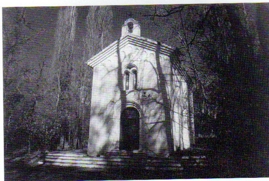
Fig. 1. Ermita de Mata-Begid. Fachada.