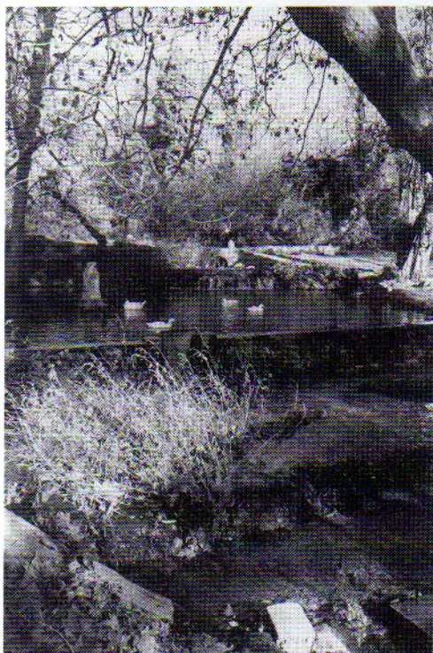
Fig. 5. Cascadas y estanque del jardín de Mata-Begid.

Parte destacada del conjunto de Mata-Begid es el jardín romántico , que da unidad a todo el complejo arquitectónico y que desde la ermita, donde se origina, desciende en forma de cascadas, estanques, fuentes y parterres, hasta la casa señorial. De ambos lados de la ermita arrancan dos canalillos de agua, al estilo de los existentes en la Alhambra de Granada, que rodean una monumental fuente de tres tazas superpuestas y de altura decreciente, en cuya base polilobulada se disponen seis ranas a modo de surtidores. Los citados canalillos se unen en uno que, tras pasar bajo un puente de un sólo vano, forma un torrente-cascada que desemboca en un estanque artificial; en el centro del mismo se con-