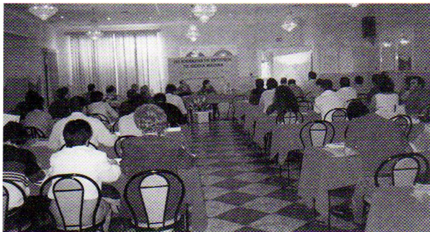
Desarrollo de las ponencias durante las Jornadas