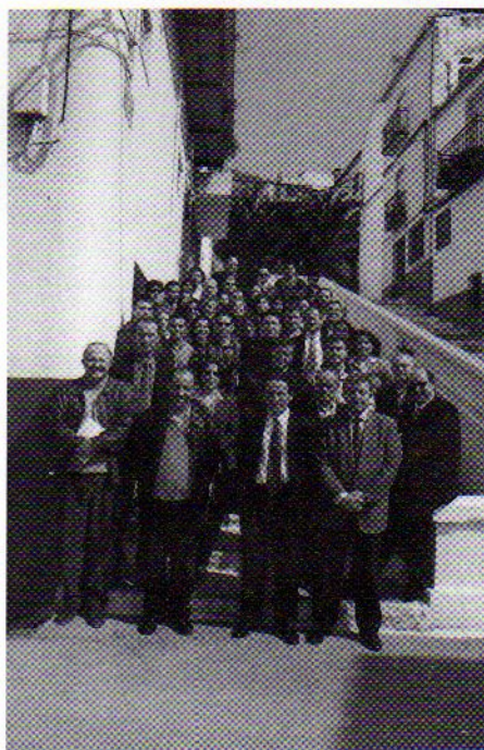
Participantes en el I Congreso Nacional sobre el Marqués de Santillana

* Presentación del número 10 de la Revista de Estudios de Sierra Mágina SUMUNTÁN . El día 23 de abril, el Colectivo de Investigadores de Sierra Mágina CISMA, presentó en el Salón de Plenos del Ayuntamiento de Larva, el número 10 de la Revista de Estudios de Sierra Mágina SUMUNTÁN. La mayoría de los artículos fueron presentados en la XVI Jornadas de Estudios de Sierra Mágina, celebradas en Larva en 1997. La presentación