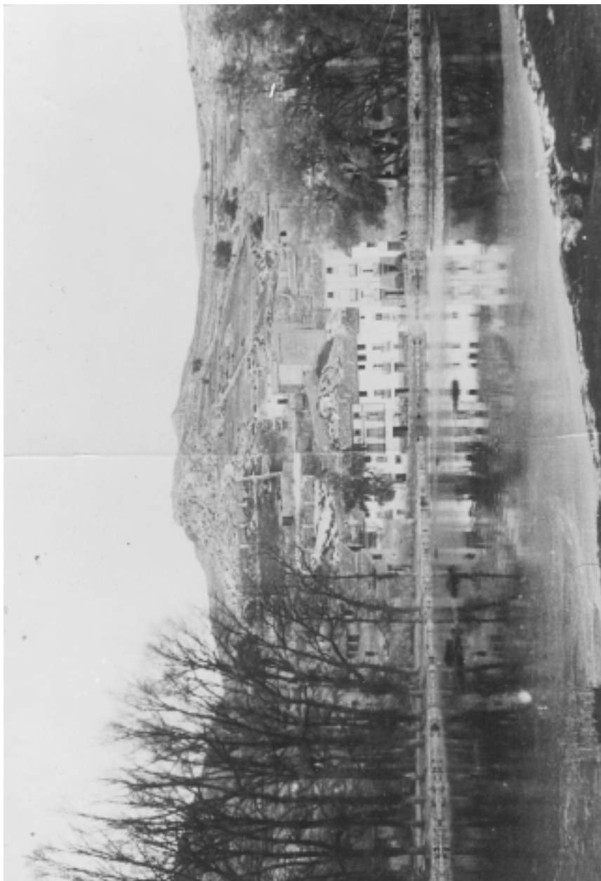
La Charca antes de la última reforma.