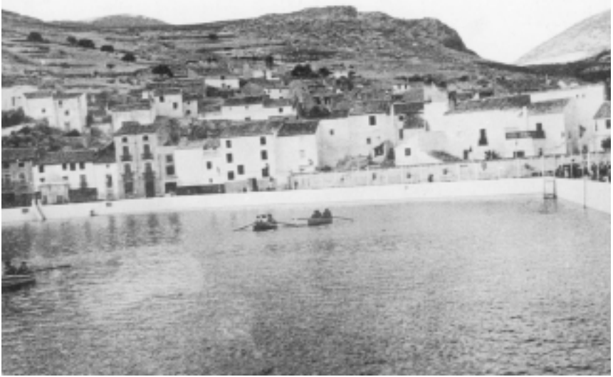
La Charca tras la reforma. Década de 1950.