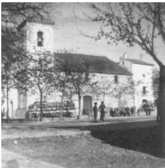
Campillo de Arenas. Iglesia Parroquial. 1969.