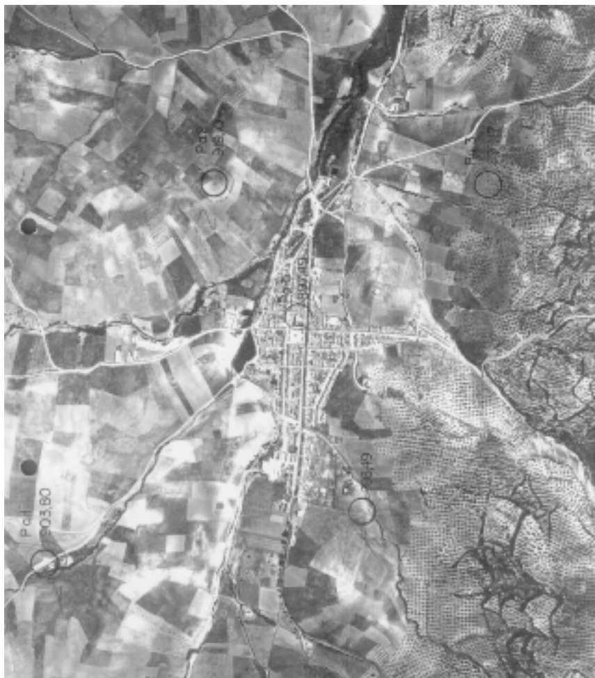
Campillo de Arenas. Vista aérea. 1977.