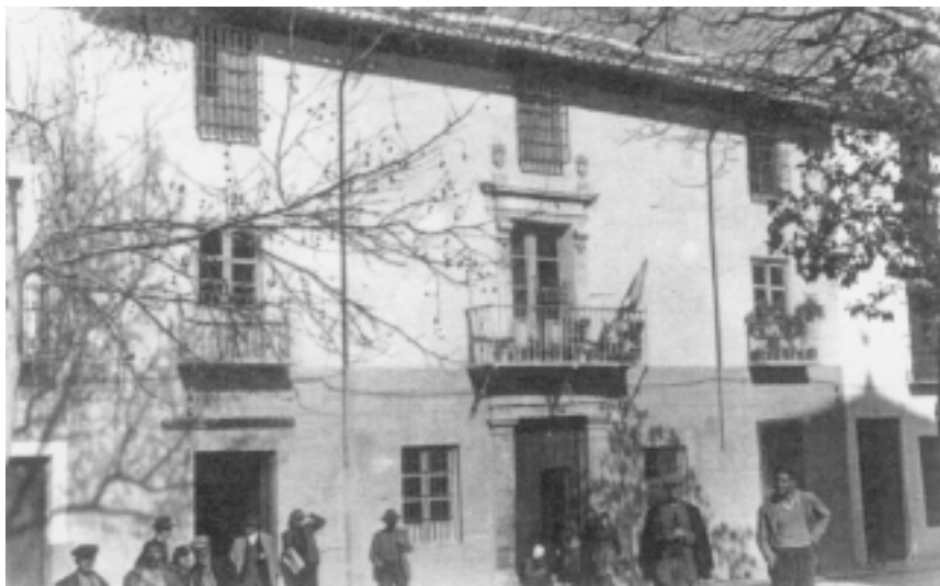
Campillo de Arenas. Antigo Ayuntamiento. 1955.