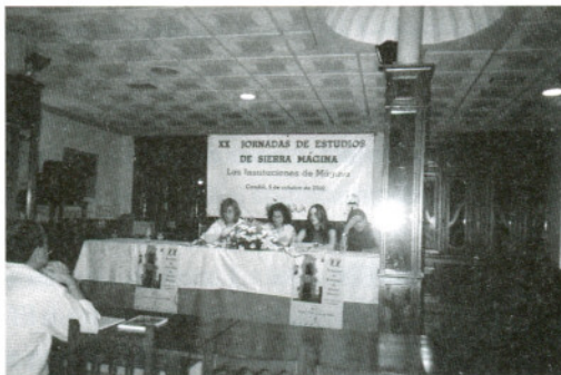
Participantes en las Jornadas