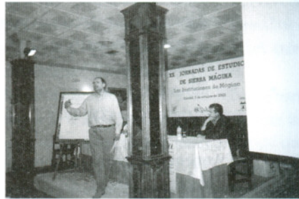
Desarrollo de las Jornadas