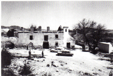
Tarahal. Iglesia y Casa Parroquial