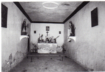
Tarahal. Interior de la Iglesia