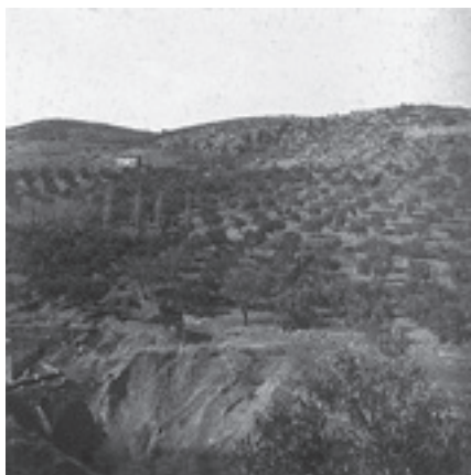
Ilustración 26.- Molino Barranco (Cabra del Santo Cristo). Tipo nº 3