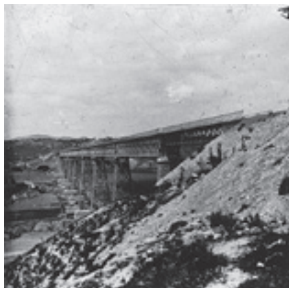
Ilustración 11.- Puente Hacho (Alamedilla-Huelma-Cabra). Tipo nº 3

Lugares que muestran algunos de los máximos exponentes de nuestro patrimonio monumental con iglesias, caso de las de Jódar - ilustración 6 - y Campillo de Arenas - ilustración 5 - que también hemos visto. Y otros edificios patrimoniales como el Pósito de Cambil - ilustración 12 -. Castillos imposibles como el de la bella localidad de Solera - ilustración 13 - en un óleo pintado por Cerdá que es uno de los escasos testimonios de su vocación pictórica. La arquitectura popular queda recogida en esas casas-cueva de Cabra - ilustración 14 - a cuyas puertas trabajaban el esparto sus