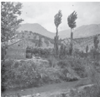
Ilustración 21.- Molino de la Manchega (Bélmez de la Moraleda). Tipo nº 2