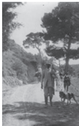
Ilustración 17.- Finca de Mata Bejid (Cambil). Tipo nº 2