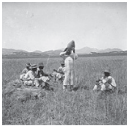
Ilustración 29.- Segadores en el Haza de la Laguna (Larva). Tipo nº 3