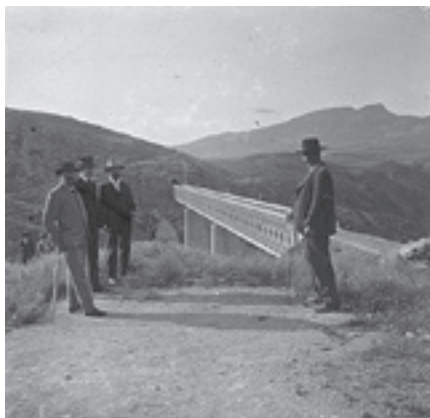
Ilustración 10.- Puente del Salado (Cabra del Santo Cristo). Tipo nº 4