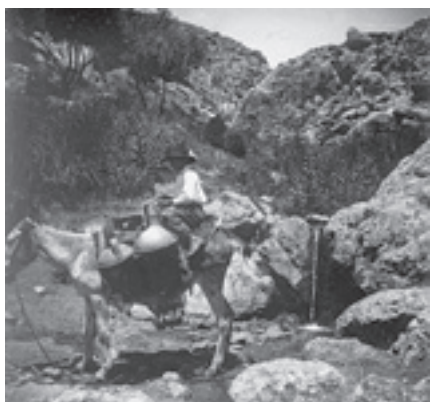
Ilustración 22.- Arroyo Santo (Cabra del Santo Cristo). Tipo nº 2