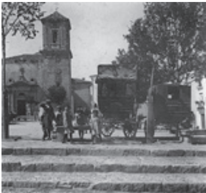
Ilustración 6.- La diligencia en la plaza (Jódar). Tipo nº 5