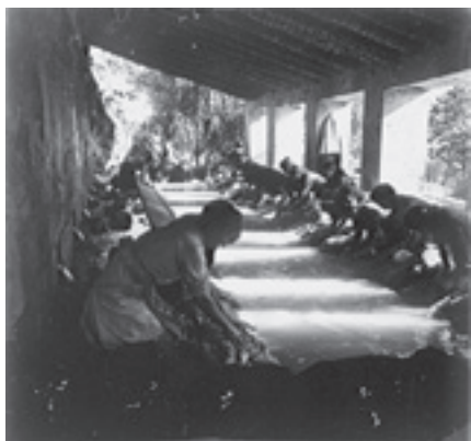
Ilustración 20.- Lavadero del Nacimiento (Cabra del Santo Cristo). Tipo nº 3