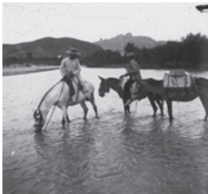
Ilustración 8.- Guadinana Menor (Quesada). Tipo nº 5