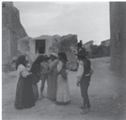
Ilustración 9.- Collejares (Quesada). Tipo nº 5