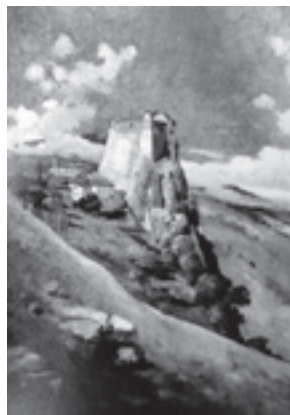
Ilustración 13.- Panorámica (Solera). Tipo nº 2