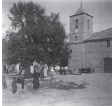
Ilustración 5.- Plaza de Campillo de Arenas. Tipo nº 1