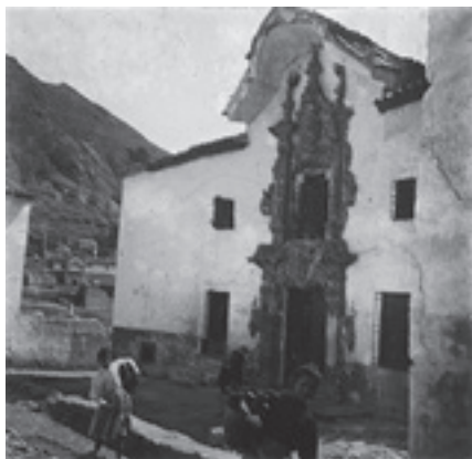
Ilustración 12.- Fachada del Pósito (Cambil). Tipo nº 2