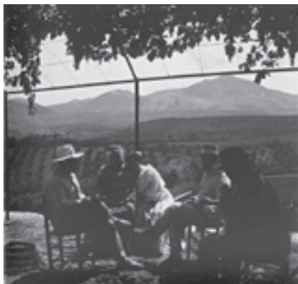
Ilustración 24.- Casería de los Alijares (Bélmez de la Moraleda). Tipo nº 2

ve otro elemento patrimonial desaparecido, un puente de probable origen medieval del que hoy sólo quedan los estribos. Ruedos de cereal alternos con el olivar como herederos de lo que antaño significó una agricultura promiscua, pues como hemos visto, la toponimia y otras fuentes documentales testimonian la existencia de numerosas viñas, tercera pata de la agricultura mediterránea por excelencia, caso de la “Viña Cercada”, junto a la era de La Quinta (Cabra del Santo Cristo) - ilustración 27 -.