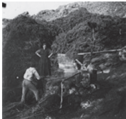
Ilustración 19.- Destilando hierbas aromáticas en la venta de la Malagueña (Quesada). Tipo n° 3

La cultura del agua tiene su máximo exponente en el lavadero del Nacimiento de Cabra del Santo Cristo -ilustración 20- , si bien es compartida en las fotos donde aparecen los molinos de la Manchega (Bélmez de la Moraleda) -ilustración 21- y en idílicos paisajes serranos como el del arroyo Santo de Cabra -ilustración 22- , lugar donde Cerdá impartió magistrales clases prácticas a otros ilustres fotógrafos comprovincianos como Eduardo Arroyo, Manuel Alcázar y Ramón Espantaleón. Hace décadas que ese manantial dejó de manar y sólo en años muy lluviosos como 2013 resurge, si bien, la carretera que va de Cabra a su estación ha modificado sobremanera su aspecto. Otro idílico paisaje representativo es el del Alhorí (Bélmez de la Moraleda) -ilustración 23- con la Morra de Magina nevada y dos bellas composiciones, la de la abuela con las nietas y la de esas serranas en distendida conversación en un paisaje agrario sin el olivar, tan presente en la actualidad.