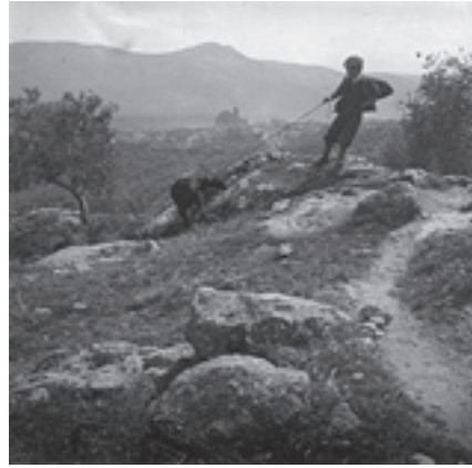
Ilustración 31.- La Cabra tozuda (Cabra del Santo Cristo). Tipo nº 3