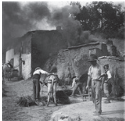
Ilustración 33.- El tejar del Royo (Cabra del Santo Cristo). Tipo nº 3