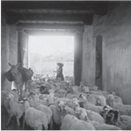
Ilustración 30.- Pastora con su rebaño en el cortijo de San Pedro (Cabra del Santo Cristo). Tipo nº 3