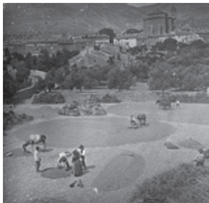
Ilustración 28.- Era de San Sebastián (Cabra del Santo Cristo). Tipo nº 3

Para finalizar, incluimos el testimonio de dos actividades hoy desaparecidas, las salinas de interior - ilustración 31 - y los tejares - ilustración 32 - que hubo hasta la década de los setenta del pasado siglo en las márgenes del Arroyo Salado (Cabra del Santo Cristo).