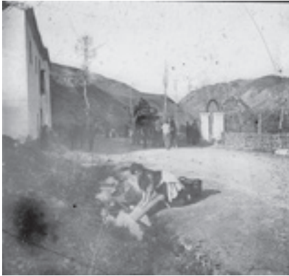
Ilustración 4.- Venta del Zagal (Cárcheles). Tipo nº 1

Andalucía. En cuanto a la foto del Hacho -ilustración 11- , la incluimos porque es la única localización que representa al paisaje número 3, pues pese a que existen fotos de los Llanos de Cabra, al no conocer su ubicación exacta hemos preferido representarlo con la foto de este emblemático puente.