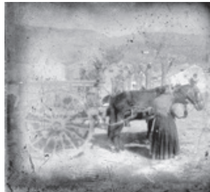
Ilustración 7.- Plaza Nueva (Huelma). Tipo nº 2