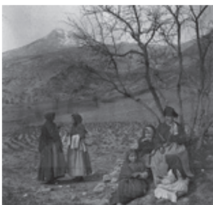
Ilustración 23.- El Alhorí (Bélmez de la Moraleda). Tipo nº 2

Aún quedaba para que el olivar ganara la partida al cereal, pero las fotos recogen testimonios de esa cultura del olivar en las caserías de los Alijares (Bélmez de la Moraleda) - ilustración 24 - y de los Palancares (Larva) - ilustración 25 -, mientras que las alineaciones de olivar de montaña se muestran en fotos como la del molino de la Manchega (Bélmez de la Moraleda) - ilustración 21 - y el molino Barranco (Cabra del Santo Cristo) - ilustración 26 -. En esta última se aprecian perfectamente las paratas de piedra seca, otro de nuestros valores patrimoniales. Pero, además, si analizamos la parte inferior izquierda de la foto, en este último enclave se