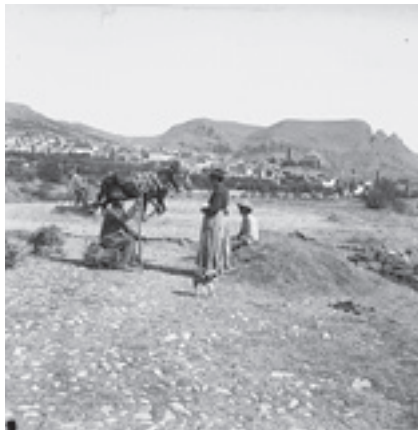
Ilustración 27.- Era de La Quinta (Cabra del Santo Cristo). Tipo nº 3