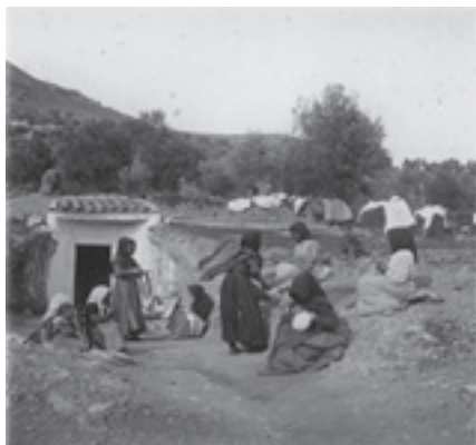
Ilustración 14.- Las Cuevas (Cabra del Santo Cristo). Tipo nº 3