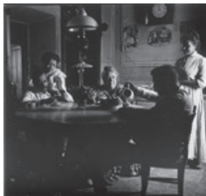
Ilustración 15.- En casa de la familia Ledesma (Bélmez de la Moraleda). Tipo nº 2