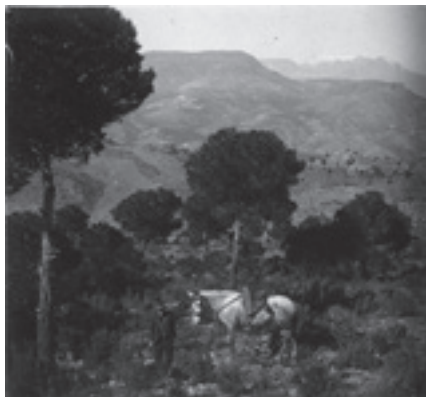
Ilustración 18.- Finca de la Higuera (Cabra del Santo Cristo). Tipo n° 3