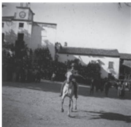
Ilustración 16.- Toros en la plaza (Cabra del Santo Cristo). Tipo nº 3

Patrimonio inmaterial y material se dan la mano en la foto de la plaza de Cabra del Santo Cristo - ilustración 16 -, secular escenario de la llegada de miles de peregrinos a este anhelado santuario. Los aprovechamientos forestales quedan recogidos en las fotos de Mata Bejid (Cambil) - ilustración 17 - y la Higuera - ilustración 18 -, finca próxima a Cabra que adquirió Cerdá para explotar su coto espartero, desde donde las vistas del macizo de Mágina, con su antesala de Sierra Cruzada, resultan bellísimas. Una actividad relictica fue la extracción y destilado de hierbas aromáticas en la Dehesa del Guadiana (Quesada) como se puede ver en la foto del alambique que había en la venta de la Malagueña - ilustración 19 -, que situada en el límite de los términos de Quesada y Cabra fue también parada obligatoria en la histórica cañada de los Arrieros por donde se sacaban los recursos naturales que atesoraba este territorio a caballo entre las comarcas de Mágina y Cazorla al que históricamente han estado tan vinculados los habitantes de Cabra y Larva.