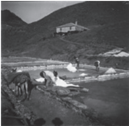
Ilustración 32.- La salina de Jesús (Cabra del Santo Cristo). Tipo nº 3