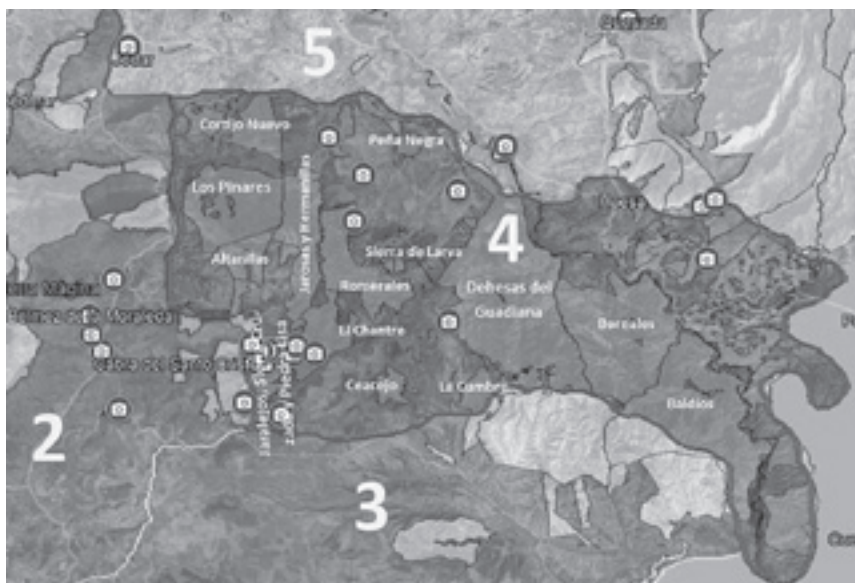
Ilustración 34.- Montes públicos del corredor paisajístico número 4. Fuentes: Google Maps, Google Earth, Geografía de la obra de Cerdá y Rico, Atlas de los Paisajes de España y Catálogo de los montes públicos de la Junta de Andalucía. Composición propia.

Ardua tarea la de recuperar este paisaje, sobre todo si tenemos en cuenta las escasas inversiones realizadas en estos seis años durante los que apenas se ha actuado en 720 de las 10.000 hectáreas calcinadas 20 . A la vista de estos datos y de la escasa atención mediática si lo comparamos con otros incendios similares, caso del ocurrido en Sierra Bermeja en septiembre de 2021, sólo nos queda pensar que esta zona es ya un verdadero desierto demográfico, situado además en una de las zonas más aisladas de Andalucía y por lo tanto no despierta suficiente interés.