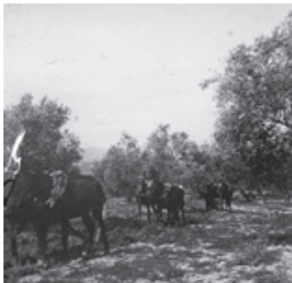
Ilustración 25.- Arando en la casería de Los Palancares (Larva). Tipo nº 3