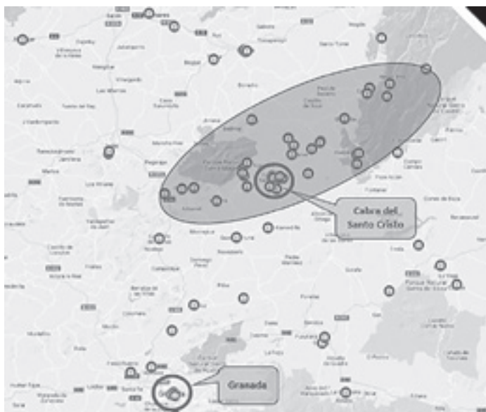
Ilustración 2.- Geolocalización de enclaves fotografiados por Cerdá y Rico en Andalucía Oriental, donde destacan las realizadas entre Sierra Mágina y la Sierra de Cazorla.

lizado, de momento, en Andalucía, aunque es nuestra intención representar la totalidad de la obra. Esta cartografía quedó publicada en la web de Acacyr ( www.ceryrico.com ) 14 y, si algo se desprende de un primer análisis de estas geolocalizaciones es ese “espacio vital” de Cerdá que se extiende por las provincias de Jaén y de Granada principalmente. Hemos de advertir que esta distribución puede resultar engañosa, pues son centenares las fotos que se localizan en dos poblaciones, Cabra del Santo Cristo y Granada, cuya representación cartográfica resultaría una ardua tarea, así que en estos lugares sólo hemos situado algunos de los enclaves más emblemáticos. Jaén, Úbeda, Baeza, Linares, Andújar, Guadix, Baza, Zújar y muchas más localidades están representadas, pero es la franja de territorio que une el sur de Sierra Mágina con el sur de la Sierra de Cazorla la que reúne mayor número de puntos. Un espacio que pertenece a dos comarcas, pero cuyos caracteres paisajísticos se parecen mucho más de lo que en principio se podría pensar.