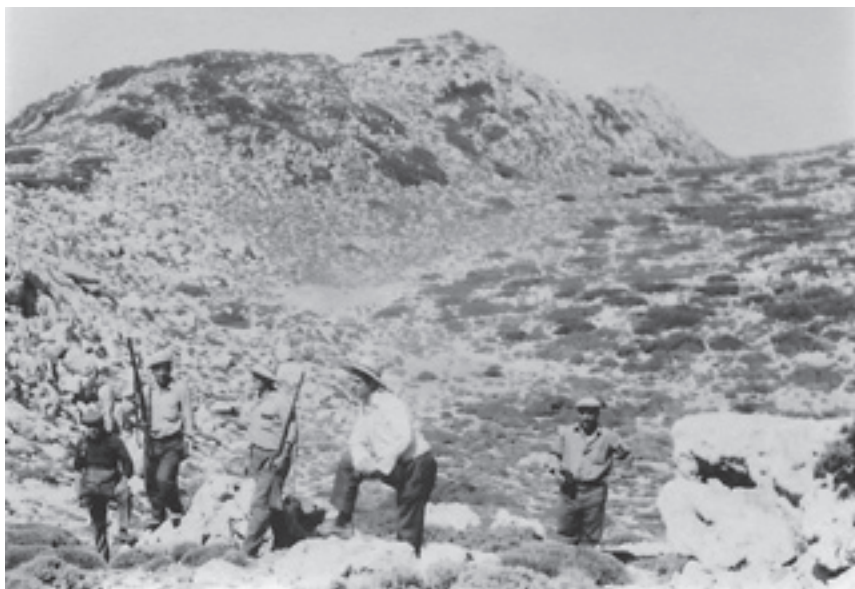
Subiendo a la Loma de Miramundos, al fondo los Hoyos de la Encantá