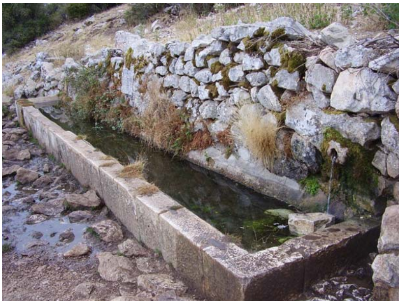
Foto 1. Vista del abrevadero.