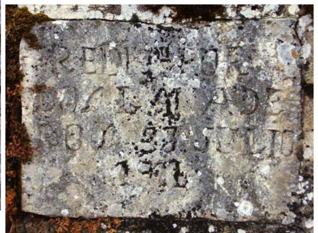
Foto 2. Inscripción.