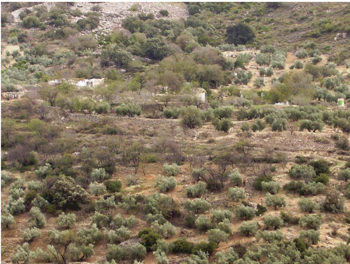
Foto 1. Vista general de la zona.

Dato: Ortofoto digital de Andalucía. E= 1:2.500