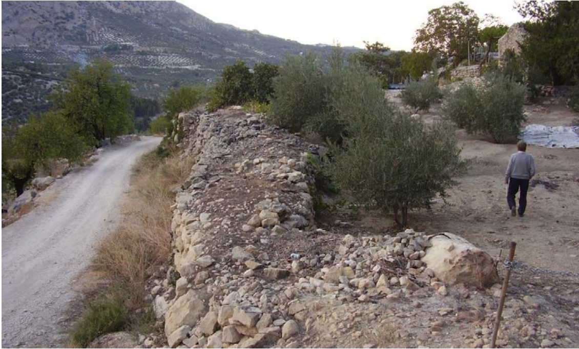
Foto 2. Vista de la albarrada ubicada junto a la Fuente de los Casares