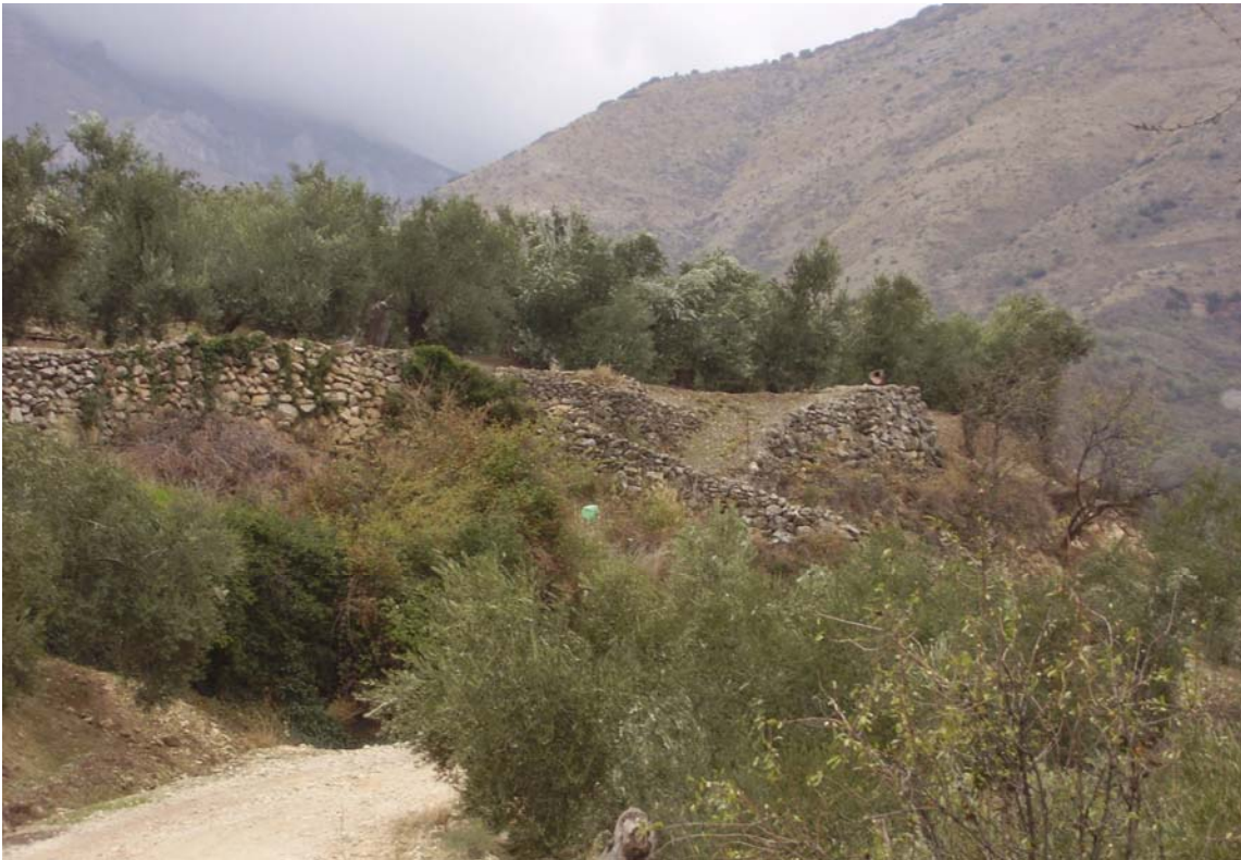
Foto 3. Vista de otra albarrada.