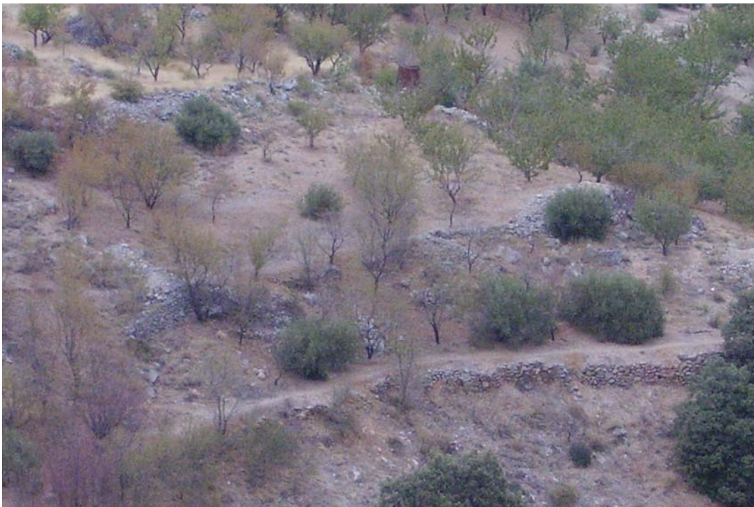
Foto: Detalle de las albarradas.

Dato: Ortofoto digital de Andalucía. E= 1:7.500