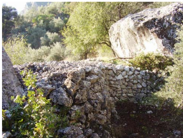
Foto 1 y 2. Vista de un lindero y una albarrada.