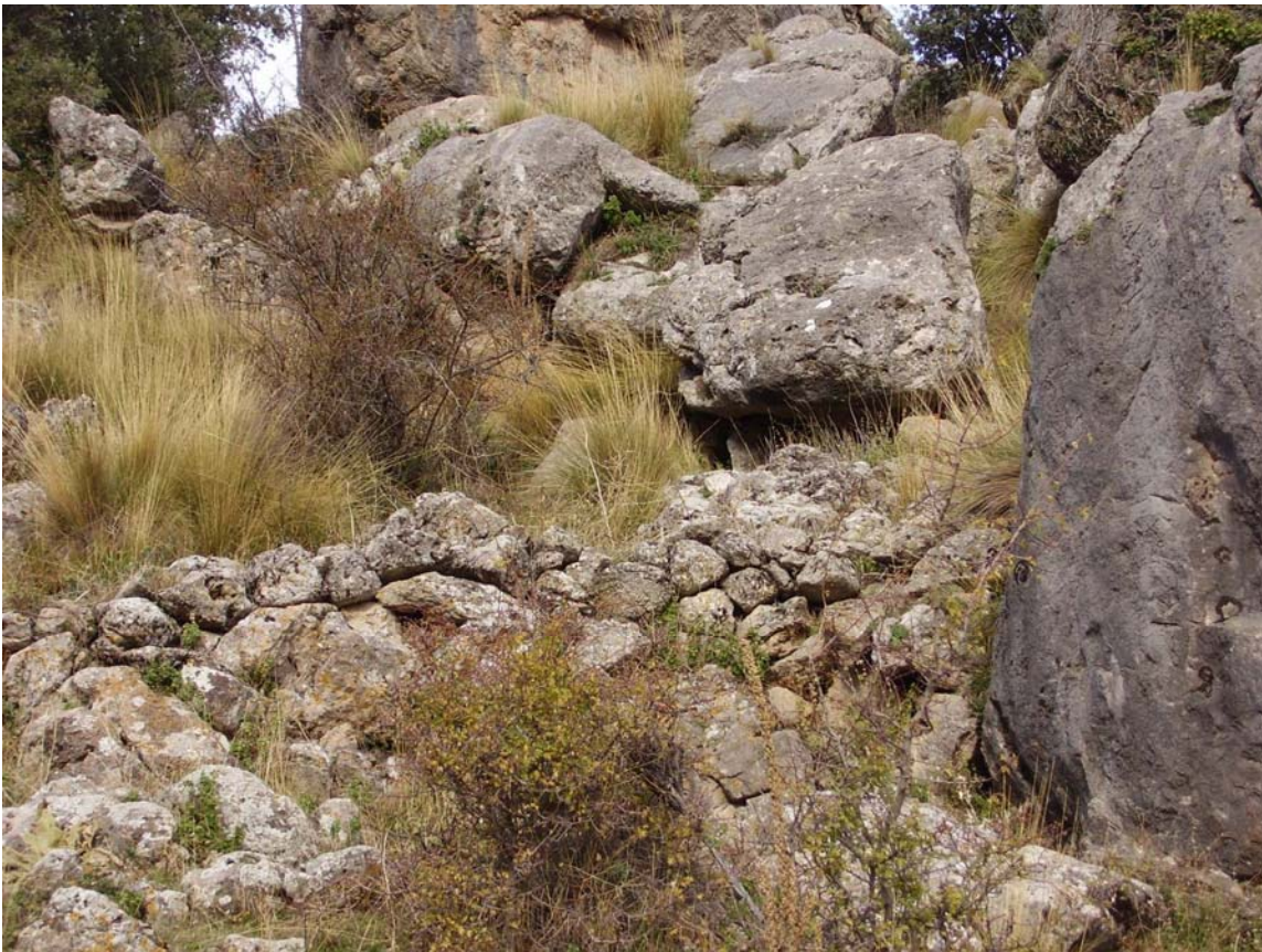
Vista 3. Detalle de una las tapias del corral.