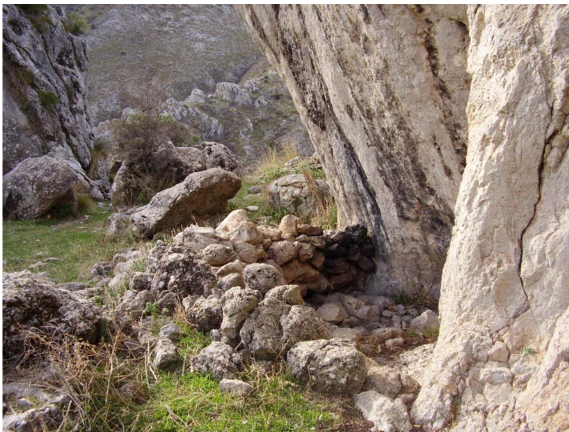
Foto 1. Vista general de la choza.

Dato: Ortofoto digital de Andalucía. E= 1:4.000