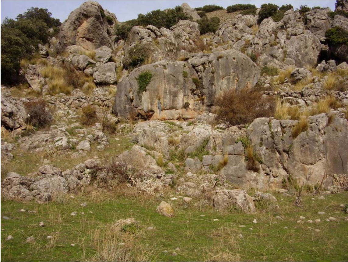
Foto 2. Vista del corral anexo a la choza.