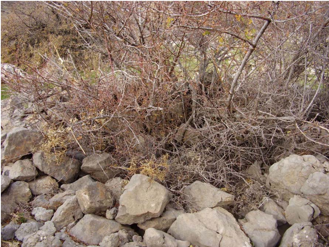
Fotos 1. Vistas del estado actual de la choza.