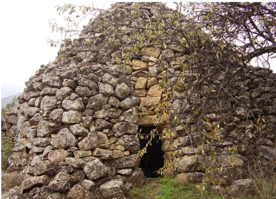
Foto 1. Vista del chozo.

Dato: Ortofoto digital de Andalucía. E= 1:5.000