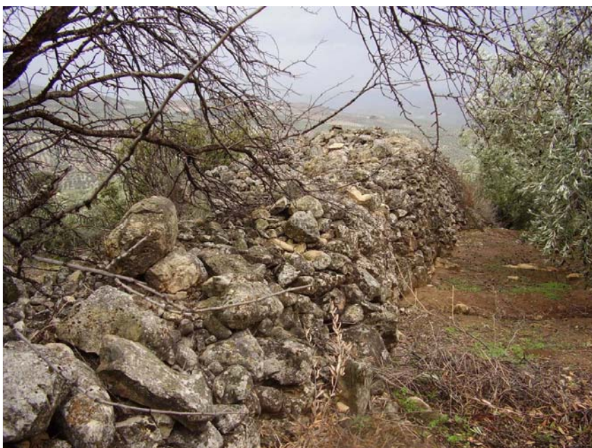
Foto 4. Detalle de la albarrada.