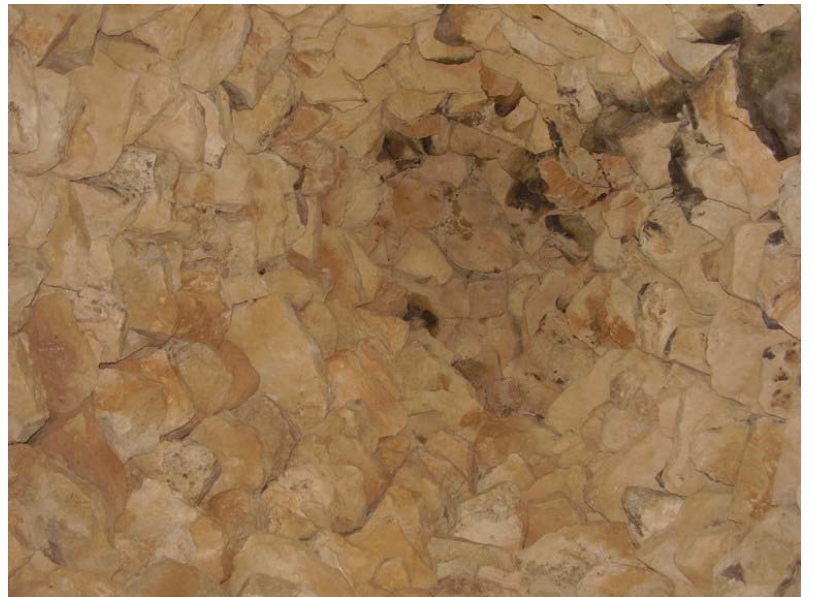
Foto 3. Detalle de la cúpula.