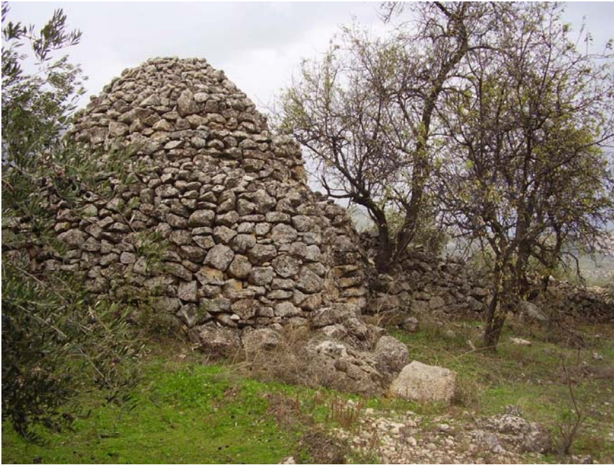
Foto 2. Vista lateral del chozo y parte de la albarrada.