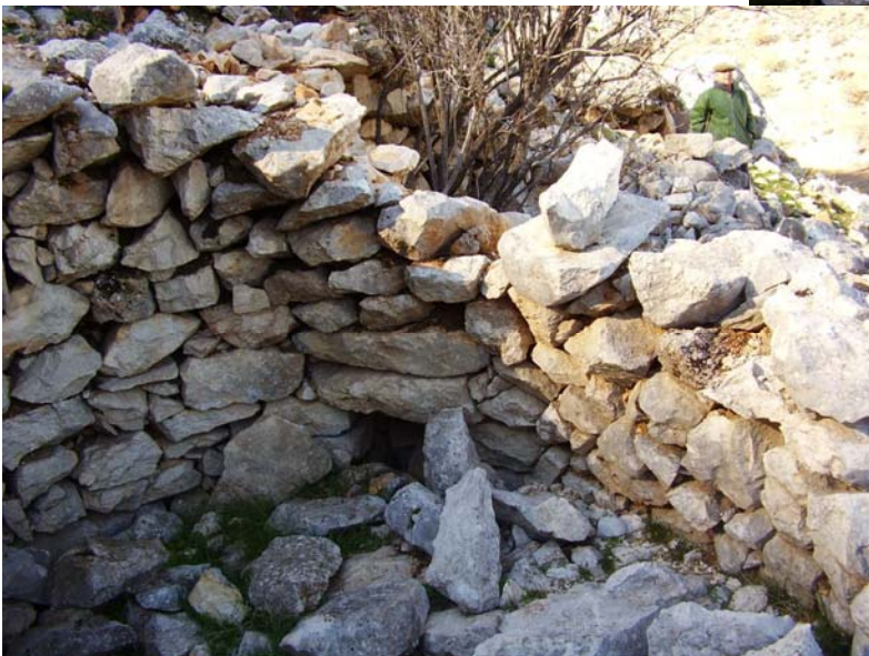
Foto 4. Vista del portillo que comunica ambos chozones.