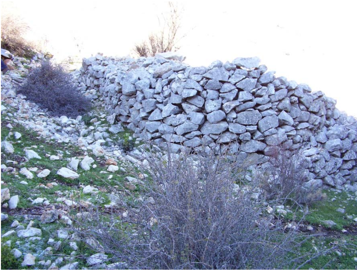
Foto 2 Vista de la albarrada que rodea a ambos chozones.