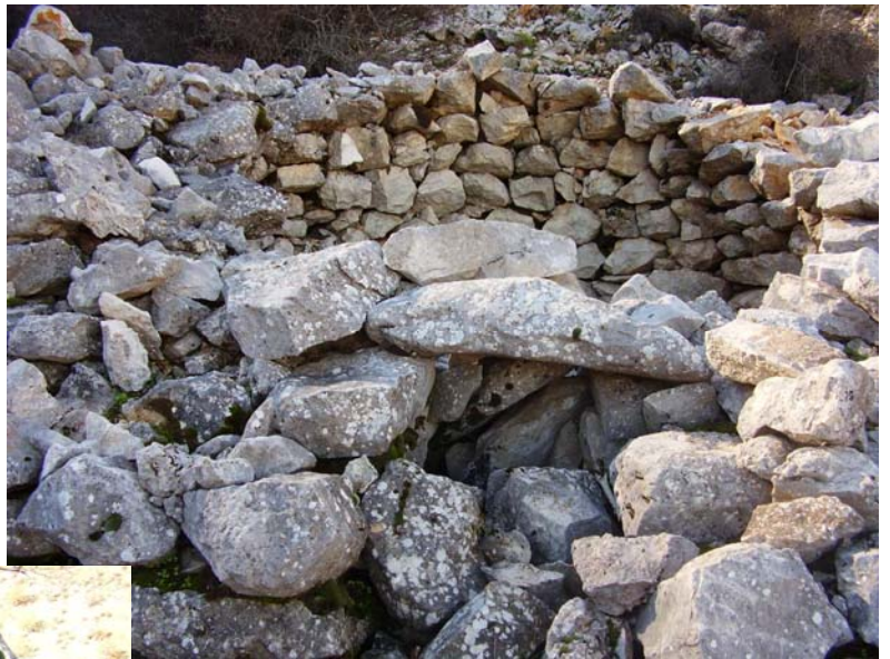
Foto 3. Vista del portillo de entrada desde el exterior del chozo ubicado al Este.