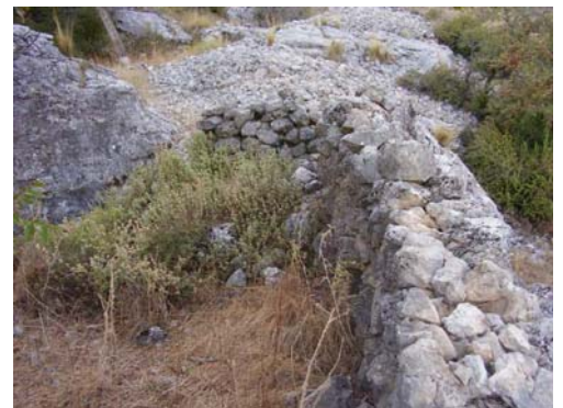
Foto 2: Detalle del muro del corral y del majano ubicado en el lado Oeste