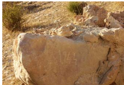
Fotos 3 y 4. Chozas anexa al corral y piedra con la inscripción del año de construcción.