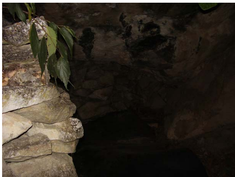
Foto 3. Vista de la estancia secundaria, covacha.