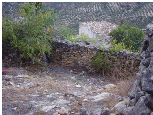
1: Vista del corral y puerta de entrada. Foto 2. Vista interior del corral.