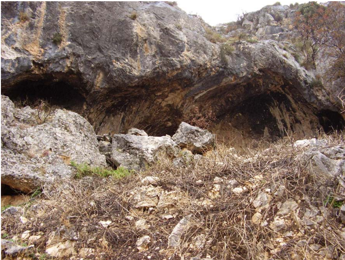
Foto 1. Vista del corral.

Dato: Ortofoto digital de Andalucía. E= 1:4.000