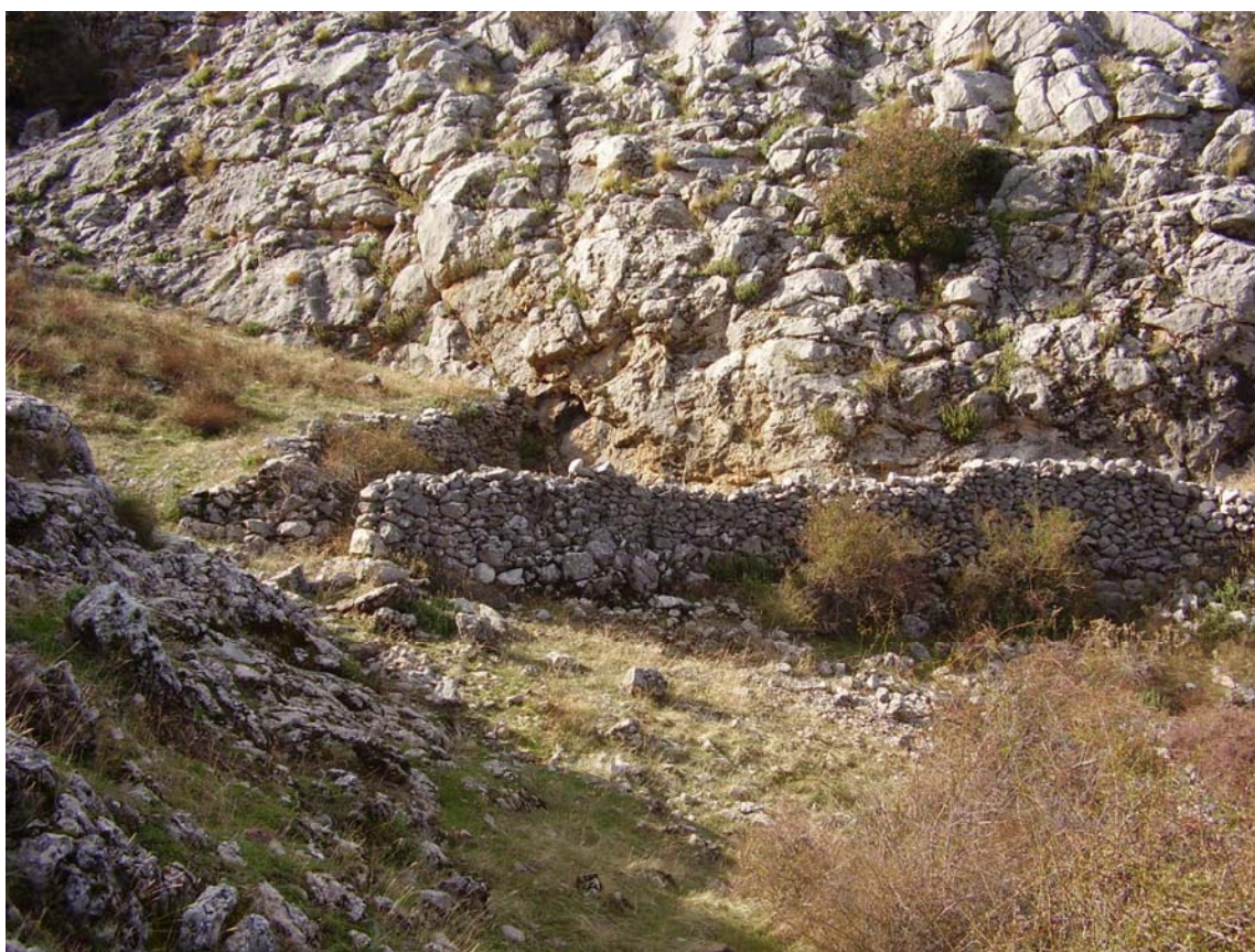
Foto 1. Vista general del corral.

Dato: Ortofoto digital de Andalucía. E= 1:7.500