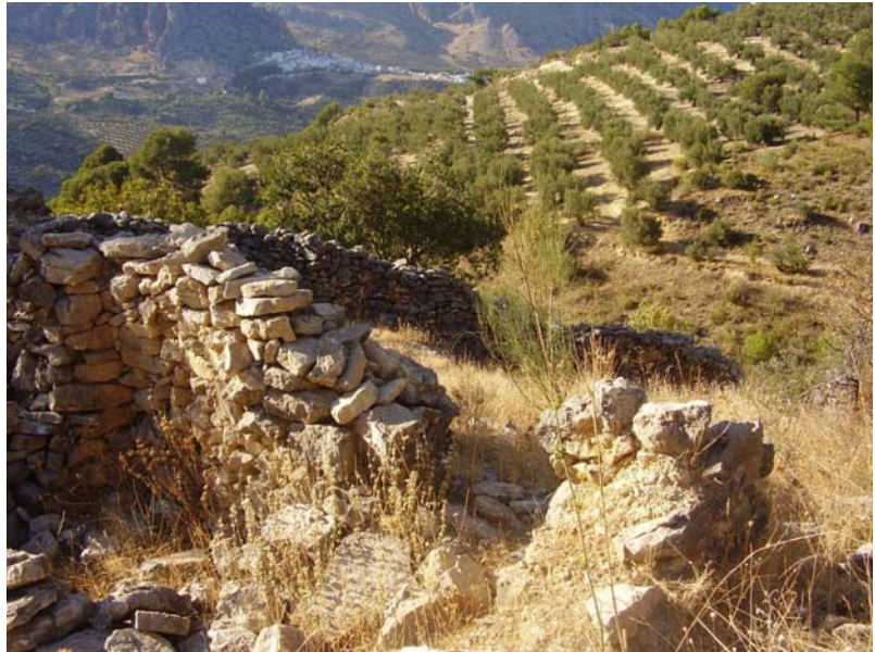
Foto 1: Vista parcial del corral y de la puerta de comunicación con el otro corral.