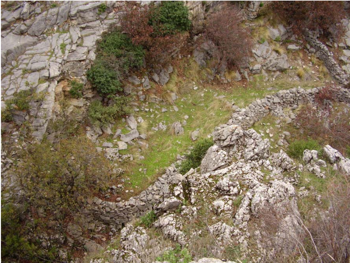
Foto 1. Vista de general de los corrales.