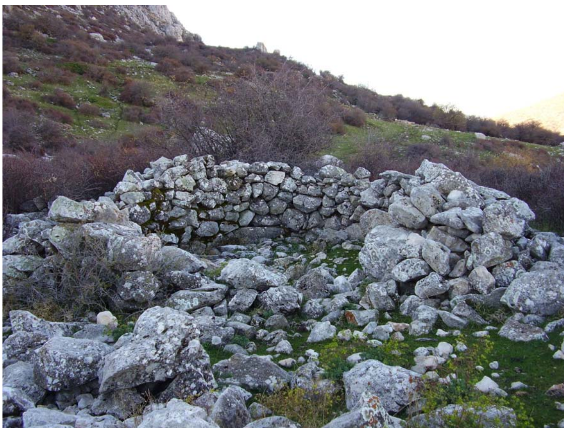
Foto 1. Vista del corralillo.

Dato: Ortofoto digital de Andalucía. E= 1:2.000