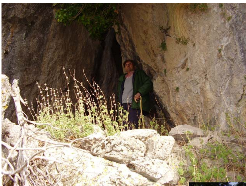
Foto 1. Vista de la cueva.

Dato: Ortofoto digital de Andalucía. E= 1:4.000