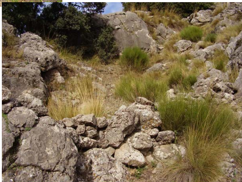
Foto 2. Vista del corral anexo a la cueva.