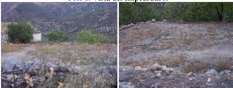
Fotos 2 y 3. Vistas de la era