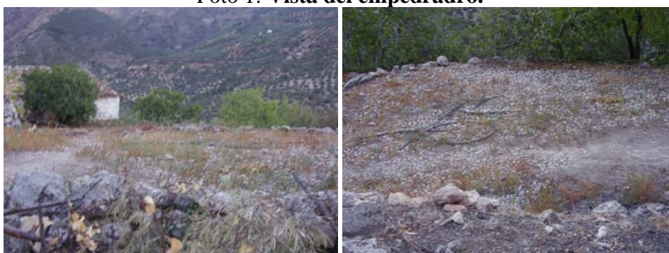
Fotos 2 y 3. Vistas de la era