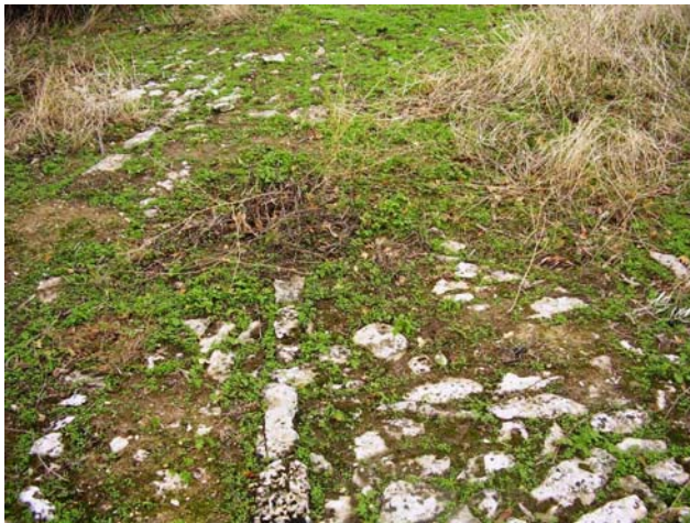
Foto 3. Detalle de la forma del empedrado.