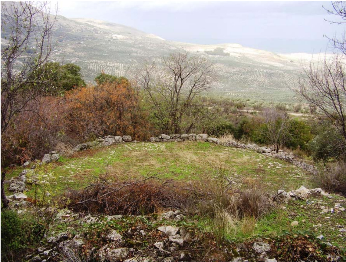
Foto 2. Vista de la ubicación del corral nº2.