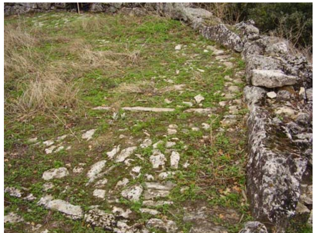
Foto 4. Detalle del borde de la era.