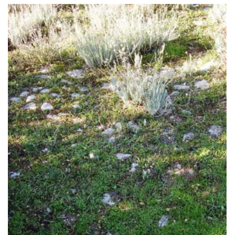
Foto 2. Detalle del empedrado.