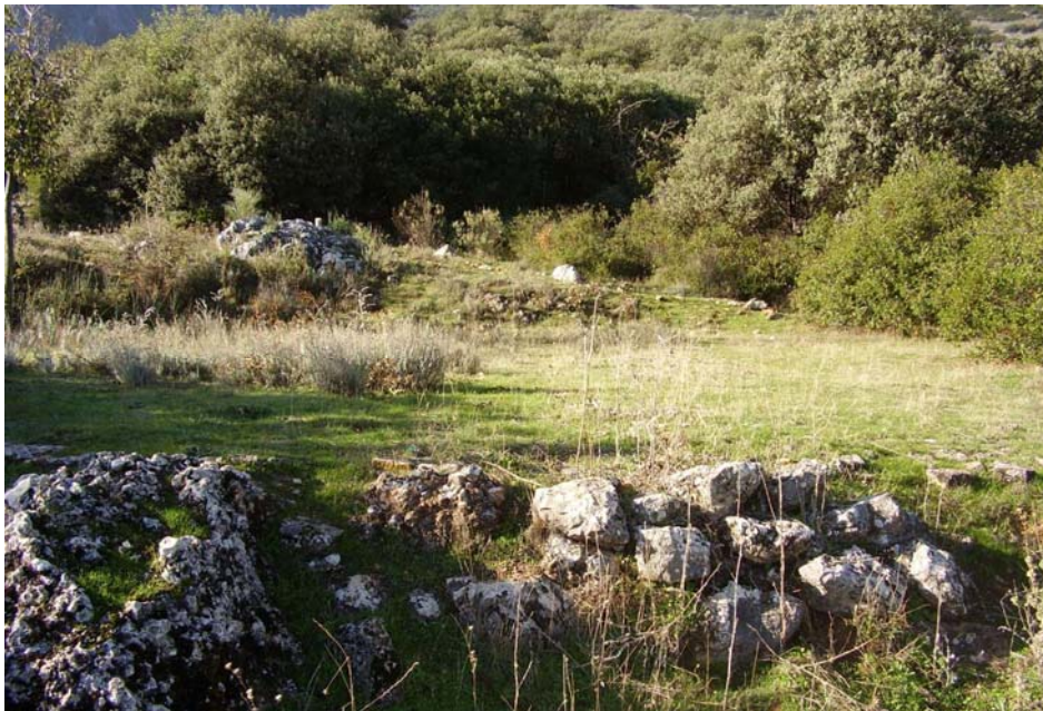
Foto 1. Vista de la era.

Dato: Ortofoto digital de Andalucía. E= 1:10.000