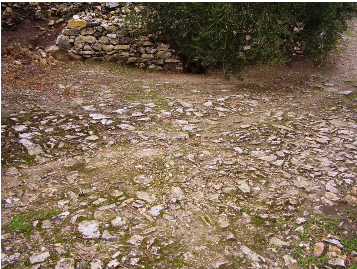
Foto 1. Vista parcial de la era.

Dato: Ortofoto digital de Andalucía. E= 1:3.500