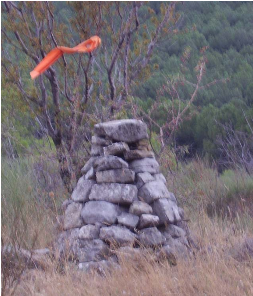
Foto: Detalle del Mojón.

Dato: Ortofoto digital de Andalucía. E= 1:10.000