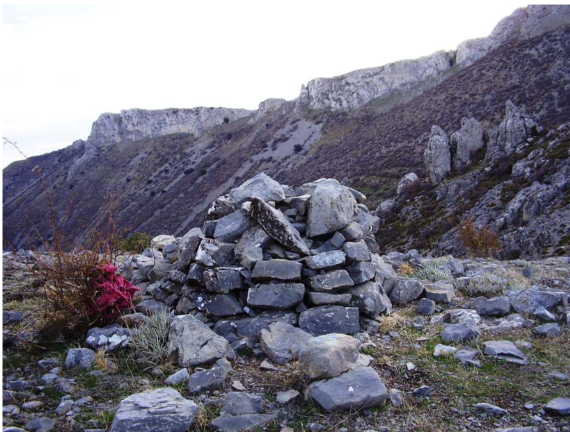
Foto 1. Vista del mojón.

Dato: Ortofoto digital de Andalucía. E= 1:4.000