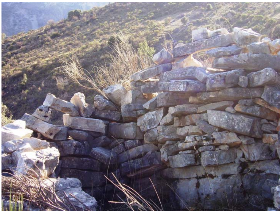
Foto 1. Vista del puesto de cuco.

Dato: Ortofoto digital de Andalucía. E= 1:5.000