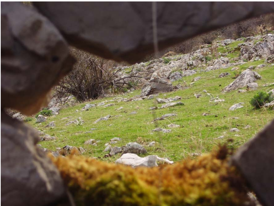
Foto 3. Detalle de la mirilla. Vista del repostero.