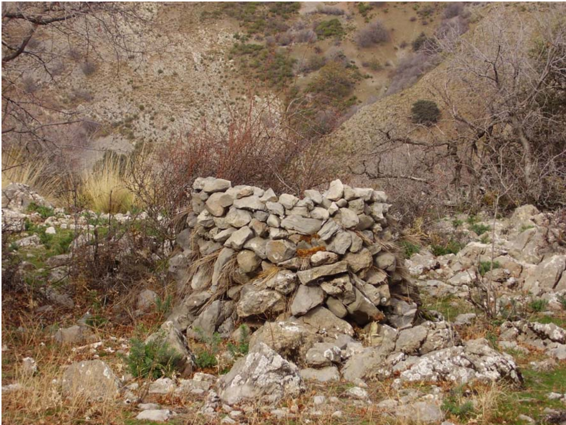
Fotos 1. Vistas del puesto de cuco.

Dato: Ortofoto digital de Andalucía. E= 1:4.000