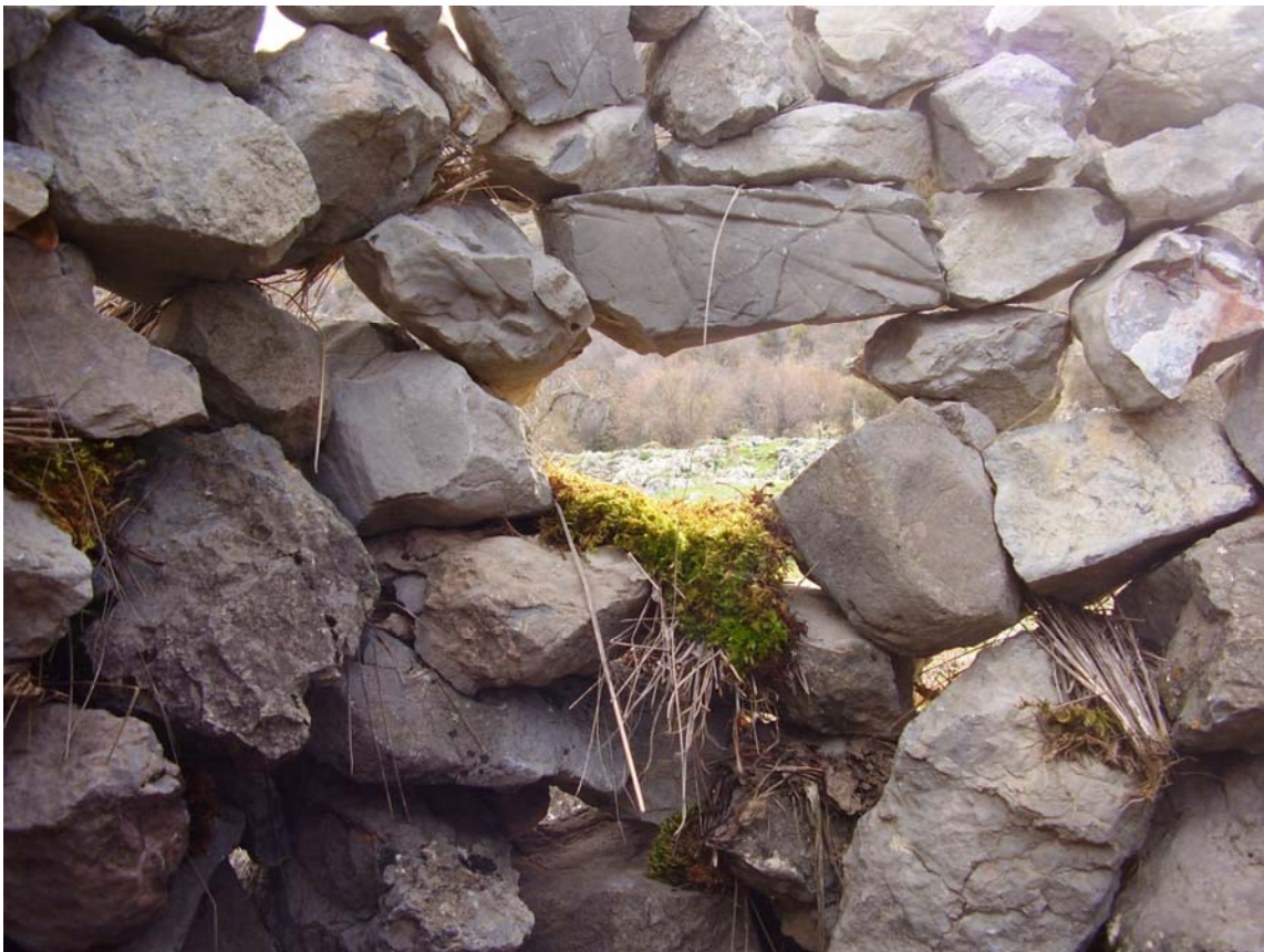
Foto 2. Detalle del tipo de construcción.