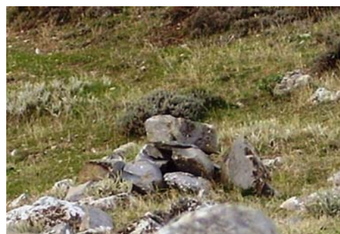
Foto 2. Repostero del puesto.