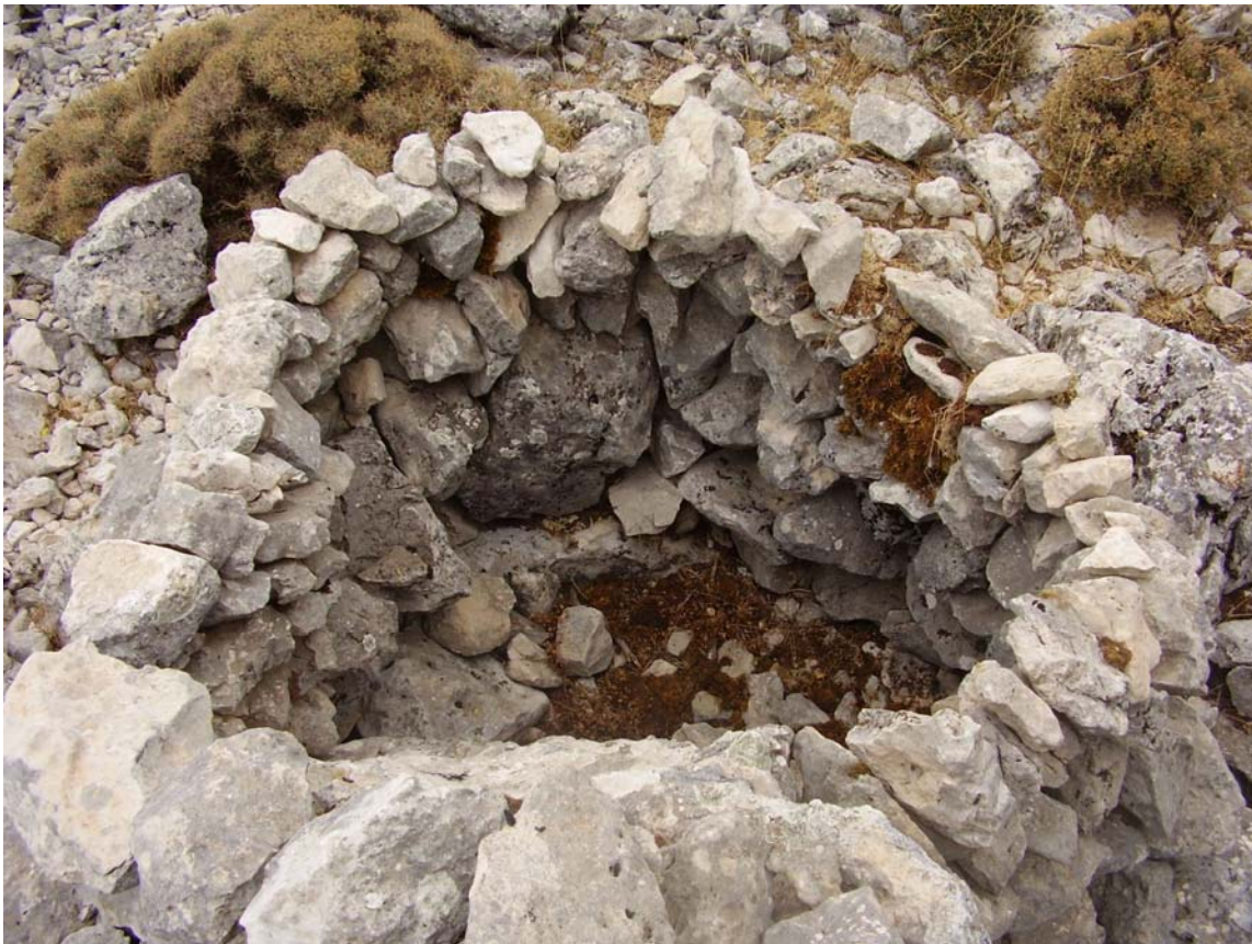
Foto 1. Vista del puesto de cuco.

Dato: Ortofoto digital de Andalucía. E= 1:2.000