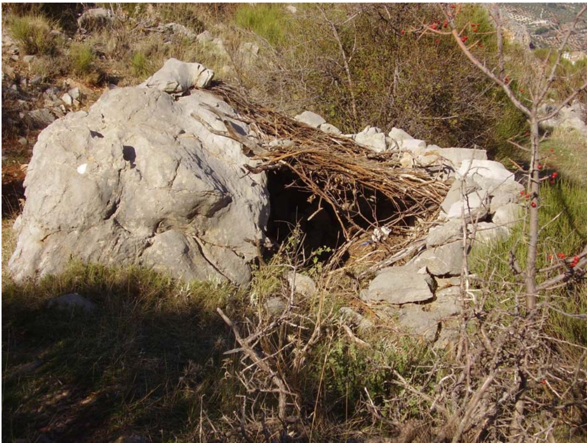
Foto 1. Vista general del ranchuelo.

Dato: Ortofoto digital de Andalucía. E= 1:7.500