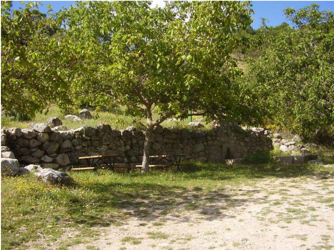
Vista general del abrevadero del pilar de las Pilas