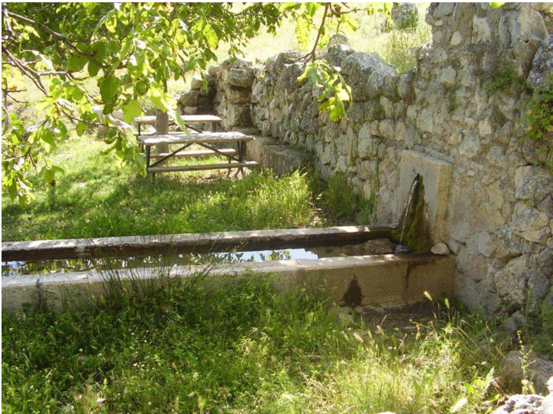
Pilar y albarrada de las Pilas