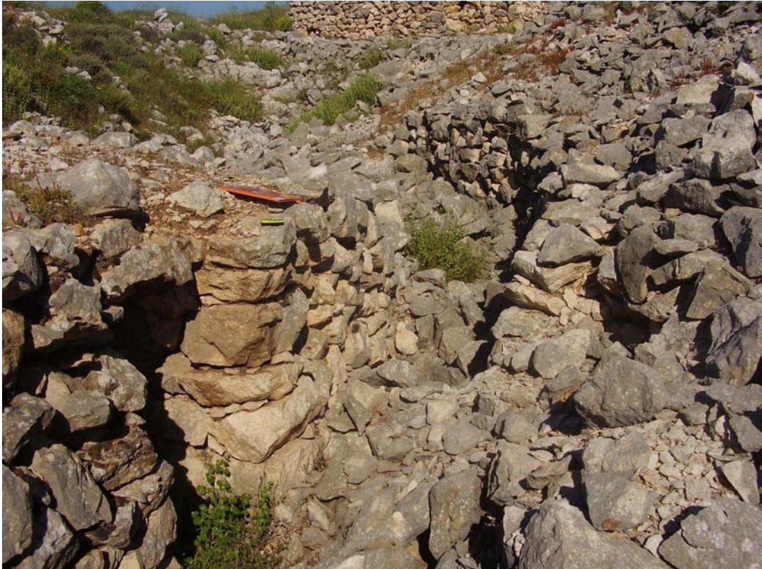
Vista del callejón ubicado junto al caracol nº1 de las Canteras del Llano de Corral Blanco