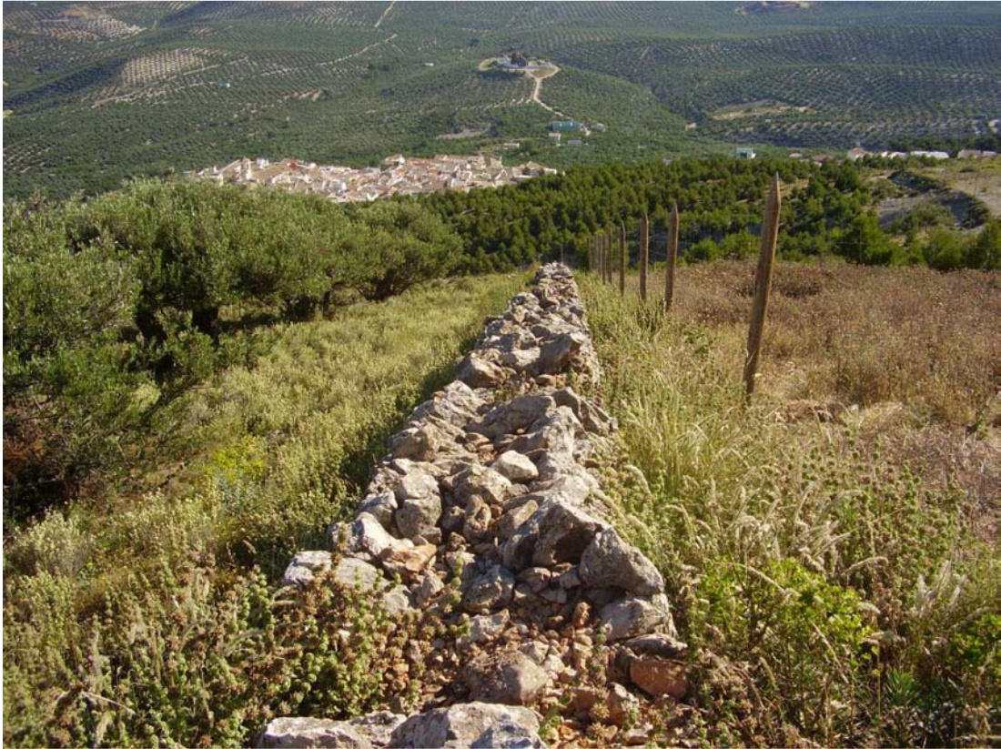
Vista general de la Horma de Varillas