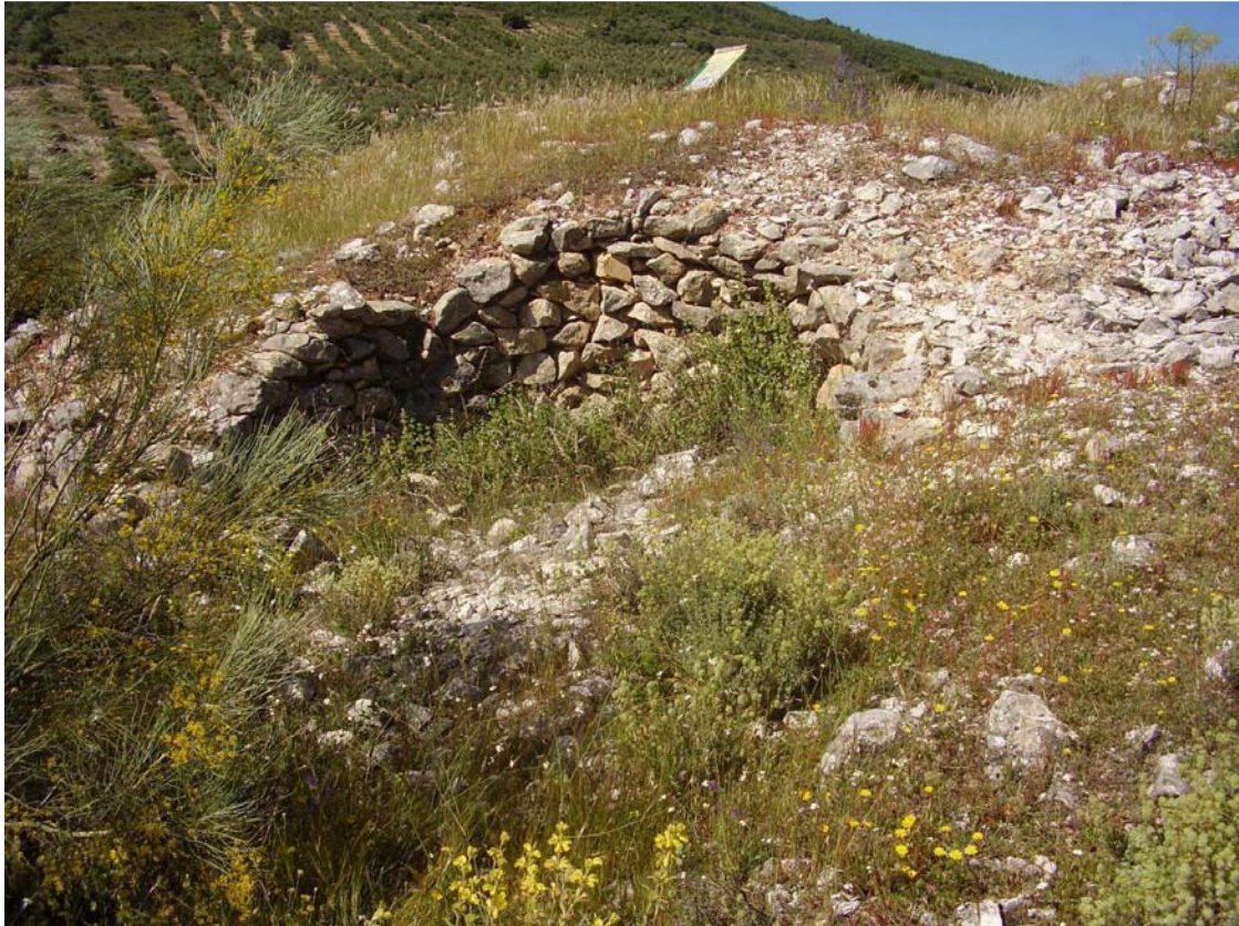
Restos del caracol nº3 de la Cañada de las Canteras