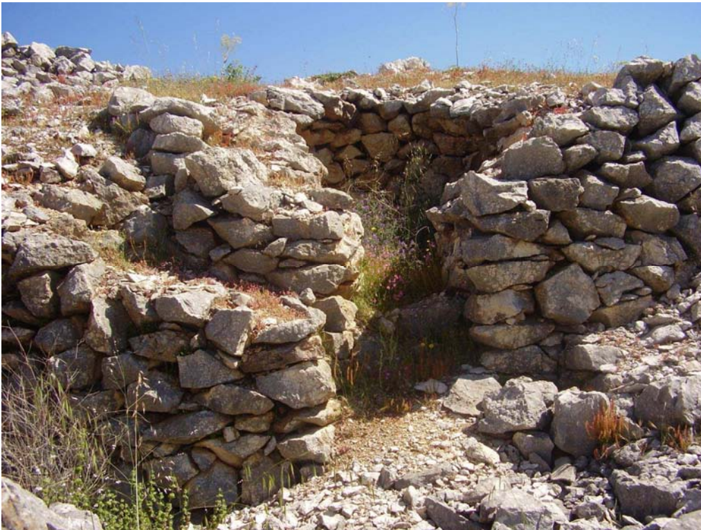
Restos del caracol nº4 de la Cañada de las Canteras