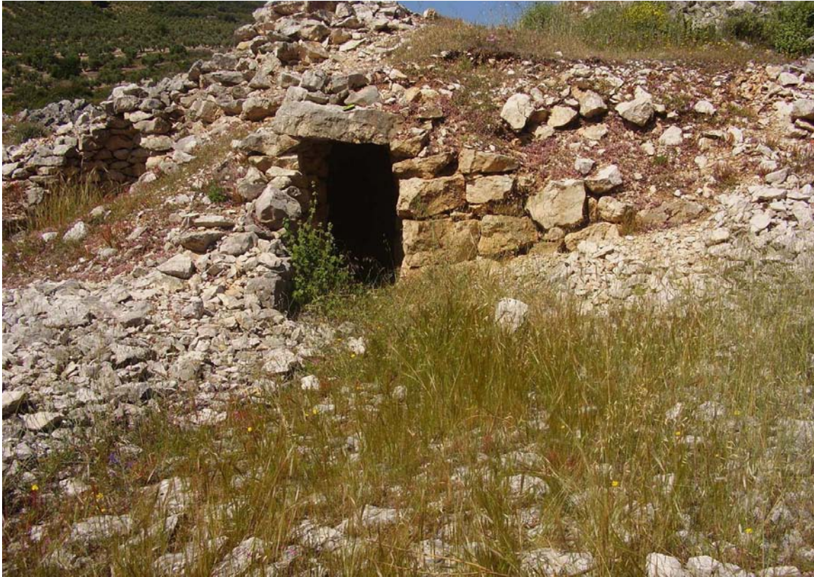
Entrada y patín del caracol nº 5 de la Cañada de las Canteras