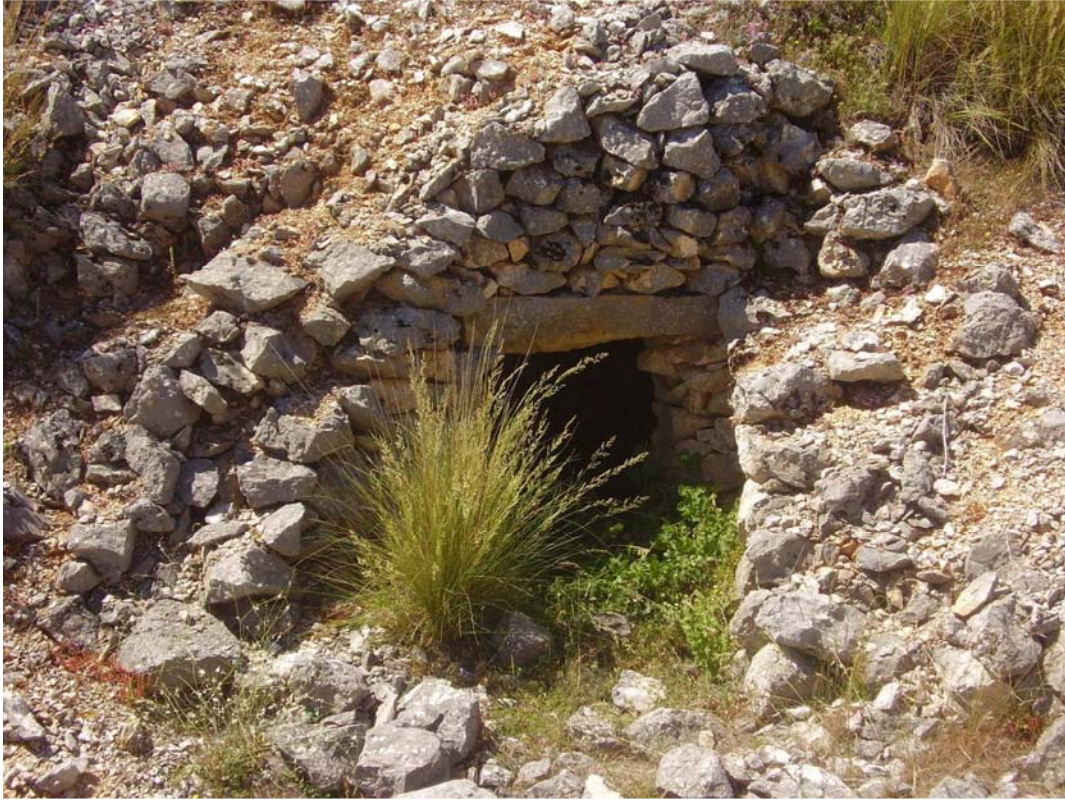
Entrada del caracol nº 6 de la Cañada de las Canteras