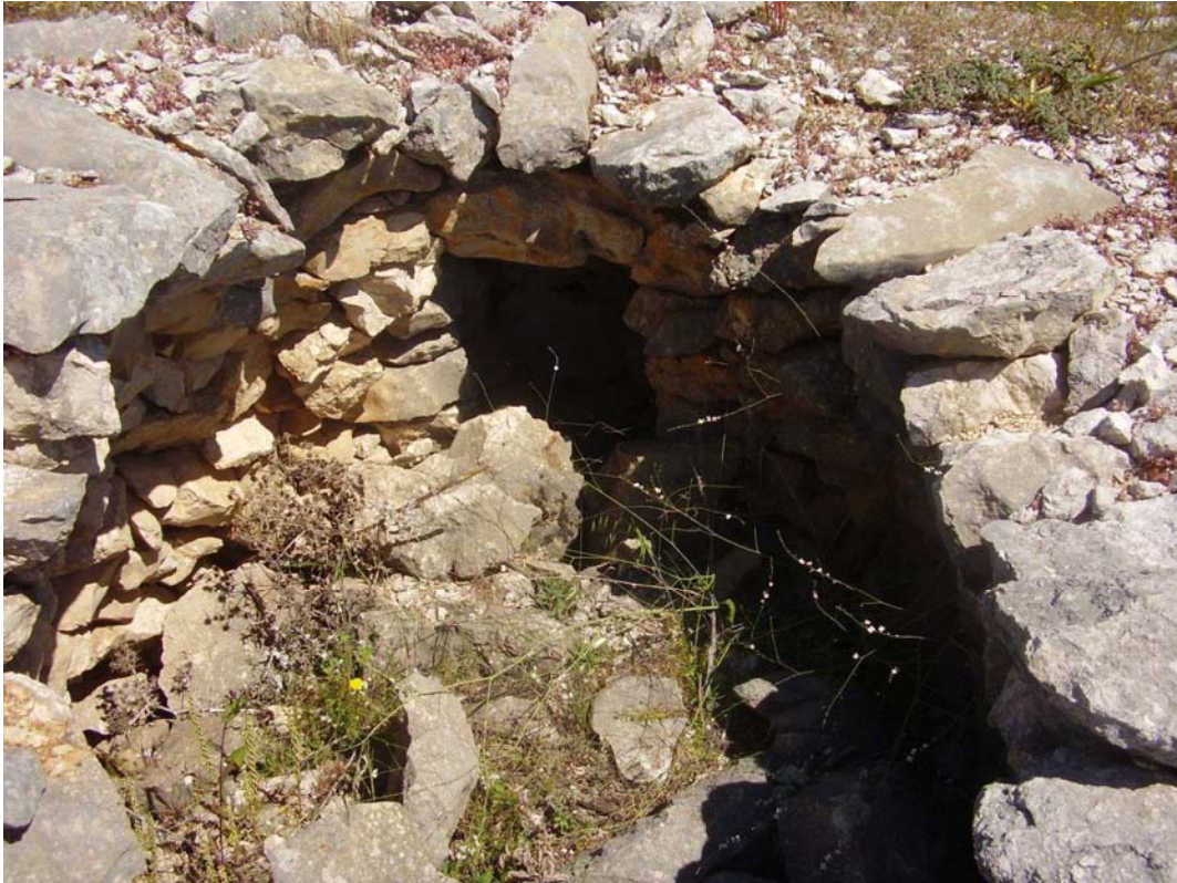
Vista de los restos del caracol nº 7 de la Cañada de las Canteras