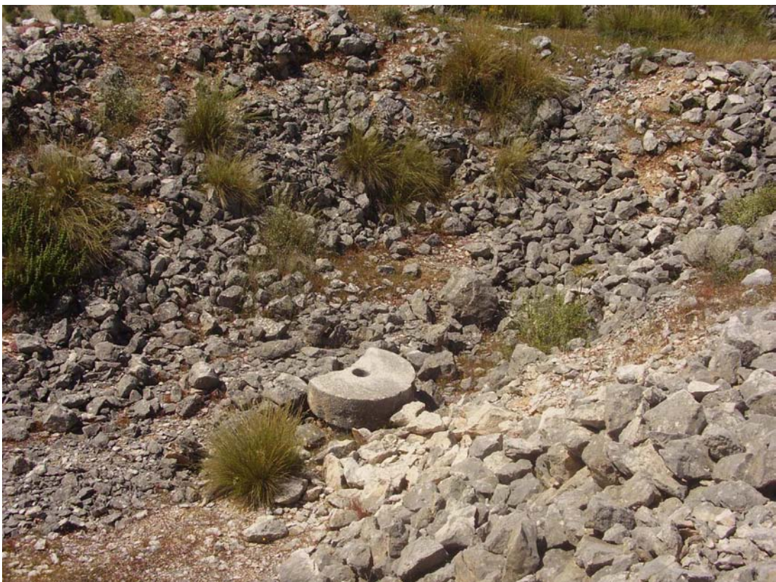
Vista de la cantera ubicada junto al caracol nº 8