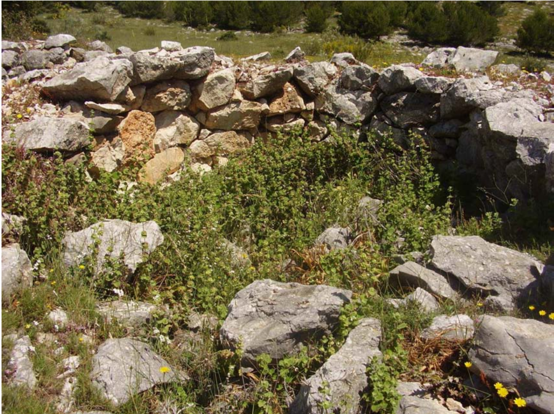
Vista de los restos del caracol nº 8 de la Cañada de las Canteras