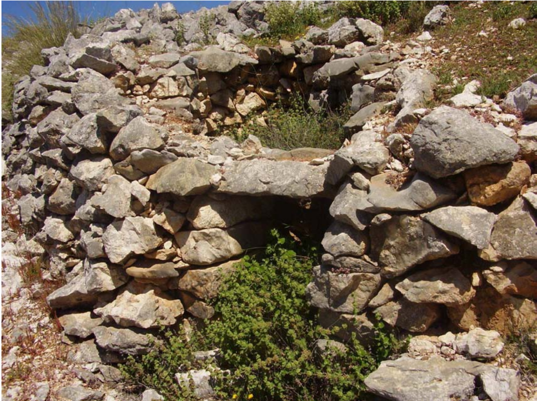
Vista de los restos del caracol nº 9 de la Cañada de las Canteras