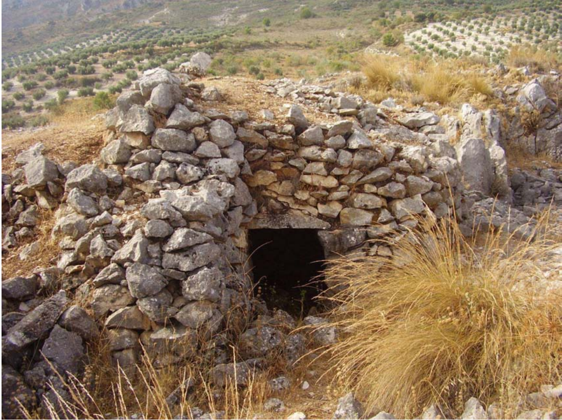
Vista de los restos del caracol nº 9 de la Cañada de las Canteras