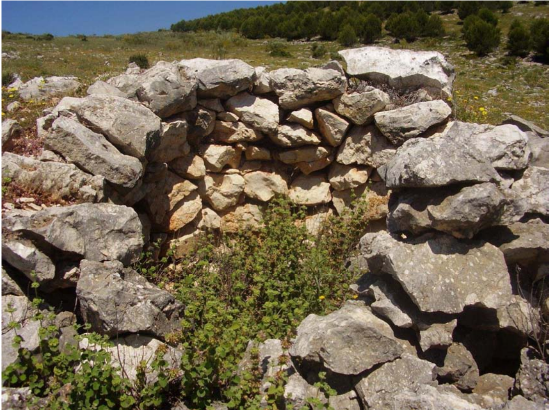
Vista de los restos del caracol nº 11 de la Cañada de las Canteras