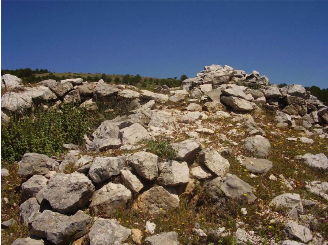
Vista de los restos del caracol nº 12 de la Cañada de las Canteras