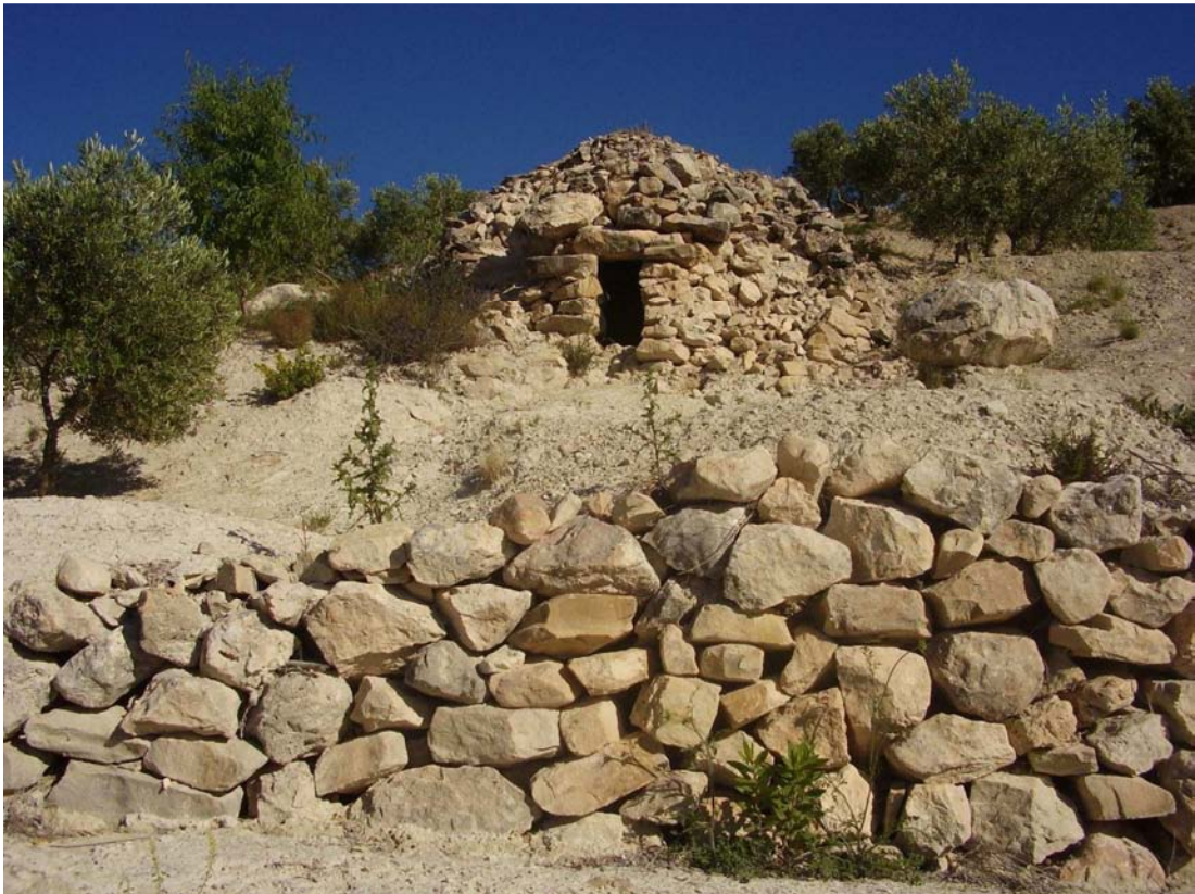
Vista del caracol de Antonio Carretero